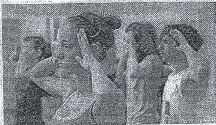
Sommerferien der ganz anderen Art: Ein Dutzend Jugendlicher übt in der Börse den „Sommertanz“ 2010 ein.