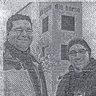
Die Wuppertaler Wortpiraten.

Wolkenburg 100, findet am Dienstag, 6. Juni , bereits ab 18.30 Uhr statt. Karten gibt es an der Abendkasse. Weitere Informationen unter www.dieboerse-wtal.de .