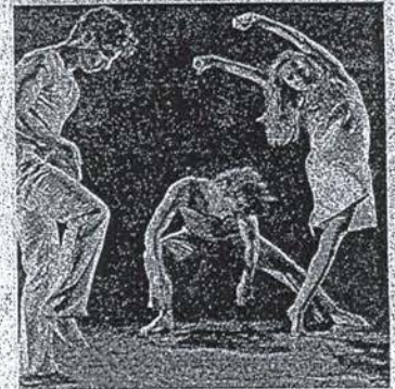
Die Vorstellung der jungen Tänzer in der Börse wurde teilweise begeistert bejubelt.