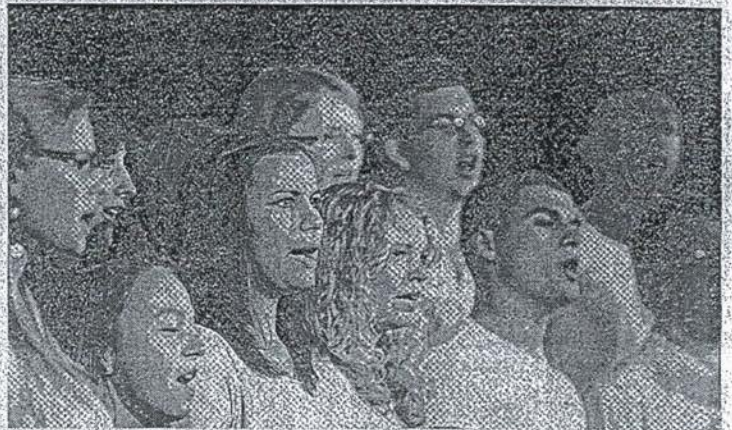
Die starken Stimmen des Johannes-Rau-Gymnasiums kamen in der Börse bestens beim Publikum an.

Oldies der 20er bis 40er Jahre wie „Ein Freund, ein guter Freund“ von den Comedian Harmonists oder das Shanty „What shall we do“ reihen ein neben dem Titanic-Klassiker „My heart will go on“ oder Michael Jacksons „Thriller“ – opulent gekrönt vom Triumphmarsch aus „Aida“. „Wir wollten eine gelungene Mischung aus alt und neu präsentieren. Dabei war uns der Widerer-