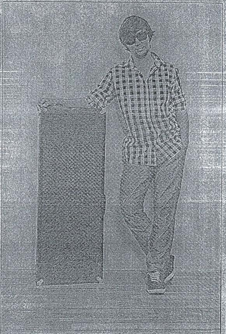
Prinz Pi hat den Koffer schon gepackt. Am 6. November kommt er in die börse.