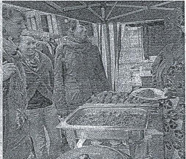
Kostproben und Begegnungen: Beim Afrika-Festival auf dem Johannes-Rau-Platz gab es auch kulinarische Überraschungen – wie hier am Stand der Togo-Initiative. Beim Wuppertaler Publikum kam das mehrtägige Programm gut an.

Ehe das WM-Spiel Ghana – Australien auf der Großleinwand in seinen Bann zog, verarbeitete eine „Mini-WM“